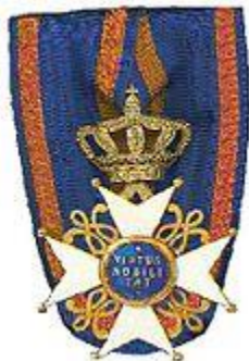
Ridder in de Orde van de Nederlandse Leeuw