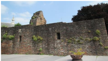
De ruïne van het kasteel.

De Hillegondakerk in zijn huidige vorm dateert uit het jaar 1500. Het interieur bevat veel delen uit die oude tijd, zo is de preekstoel van 1631, dus na de huwelijksvoltrekking van onze stamvader.