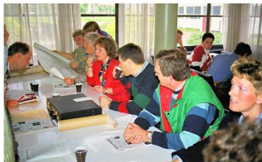
De eerste stamboom op een rol behang van de 's-Gravendeelse Moretten had grote belangstelling.