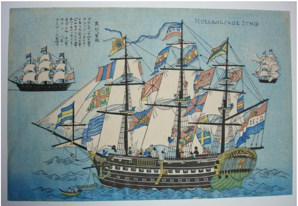
e-prent van de Bark Nagasaki zie blad 2