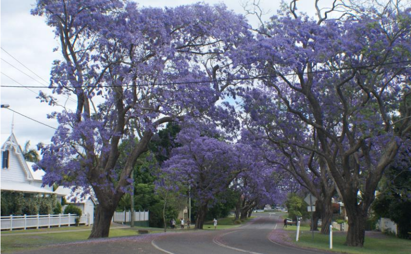
Laan met Jacarandabomen in Grafton.