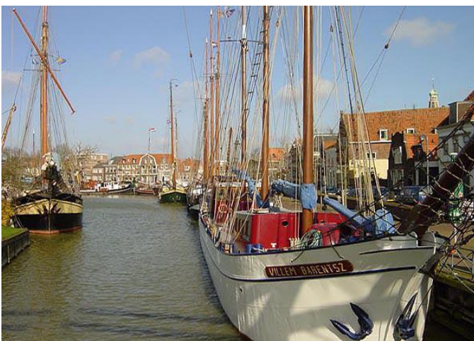
Zicht op de Willem Barentsz

Het Zuiderzeemuseum presenteert Nederlandse kunst, cultuur en erfgoed op de grens van land en water. Tentoonstellingen en evenementen leggen verbanden tussen de collectie en hedendaagse ontwikkelingen. Klassieke Hollandse thema's krijgen een verrassende benadering.