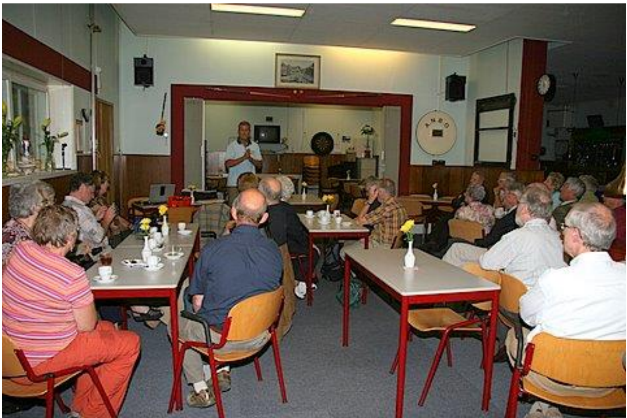
Opening van de Familiedag.