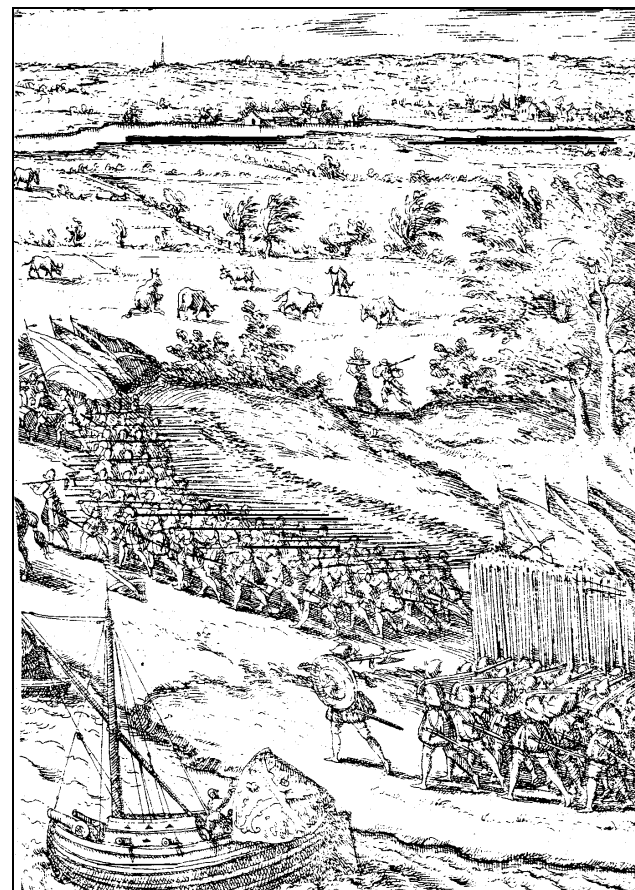
Piekeniers. Een afbeelding uit het familieboek

In 1814 deed Teunis Moret, de herbergier in Numansdorp waarvan enkele takken Moret afstammen (zie de tabel 1 in het Familieboek) dienst in de Landsmilitie met een piek. Dit was toen nog een enige legeronderdeel met pieken.