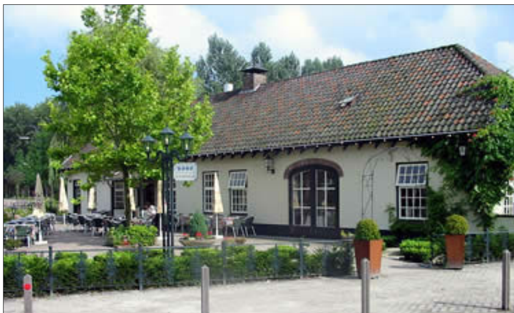
'De Boerenhofstede' waar het feest gehouden werd.